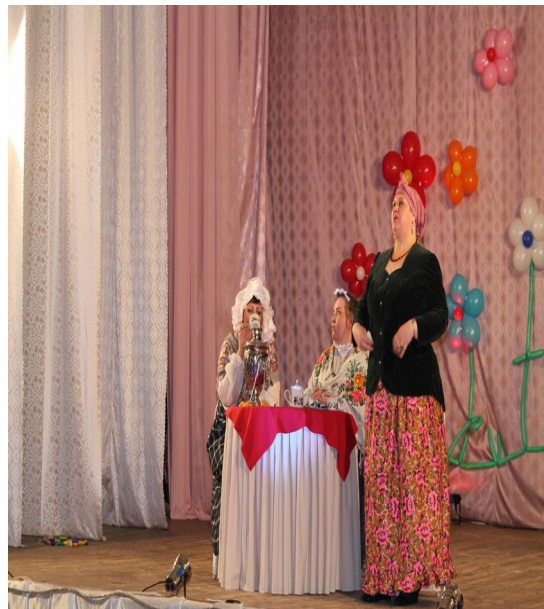
Общесельский фестиваль «Родные узоры» Сцена из пьесы «Женитьба» Н.В. Гоголя