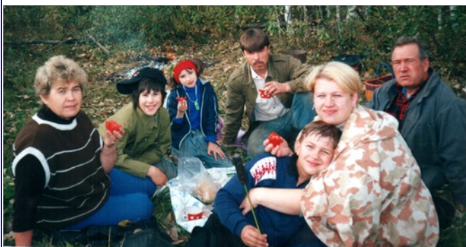
Выход есть всегда, везде!