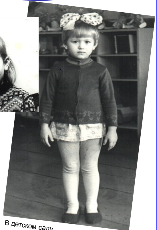
В детском саду